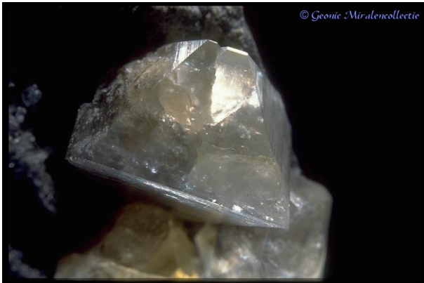
Wardiet, Yukon, Canada