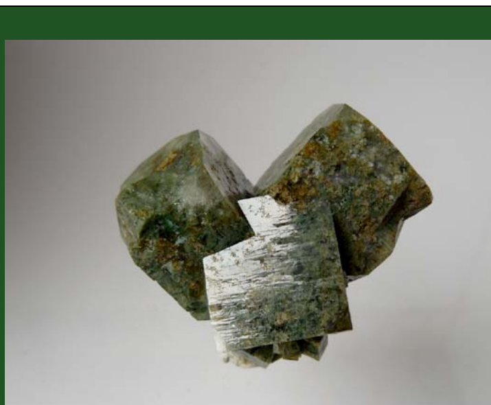
Apophylliet met seladoniet insluitsels, Mahadori, India