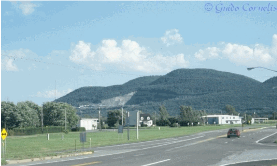
Mont Saint Hilaire, Québec, - foto Guido Cornelis (†)