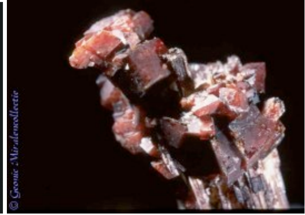
Rodochrosite op aegerien, Mont Saint Hilaire, Québec