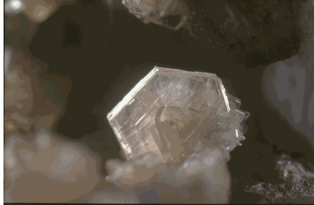
Sabinaiet, Mont Saint Hilaire, Québec