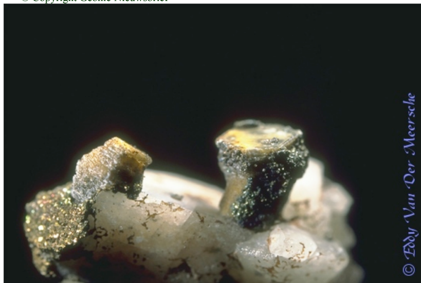
Donnayiet, Mont Saint Hilaire, Quebec, Canada / Geonic mineralen Collectie Foto: E. Van Der Meersche / Uit het boek "Minerals with Belgian Roots, pag. 133