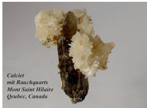
Calciet mit Rauchquartz Mont Saint Hilaire Quebec, Canada