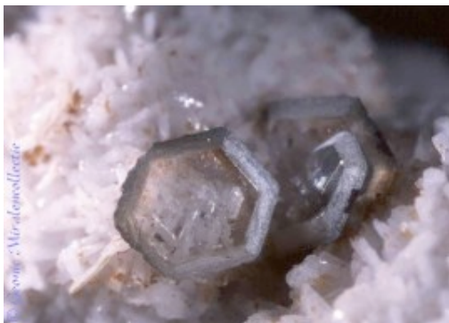
Catapleiet, Mont Saint Hilaire, Québec